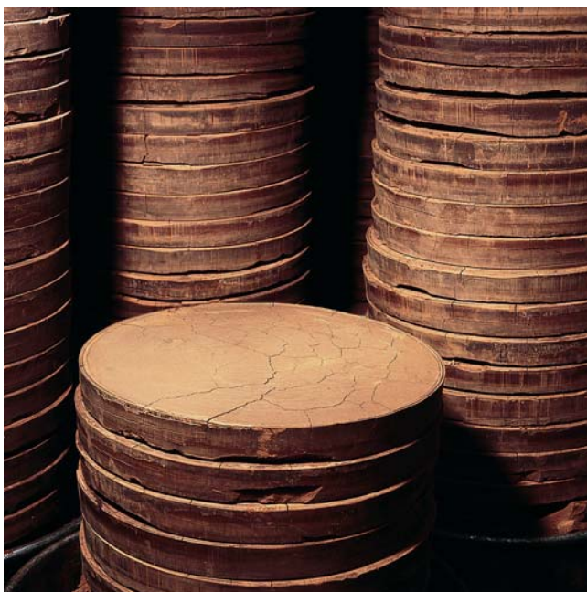
Infozentrum Schokolade, Leverkusen

Wenn die Bohnen in den Verbraucherländern angekommen sind, werden sie in Fabriken gereinigt und anschließend geröstet. Dabei entstehen das typische Aroma und die braune Farbe. Die Schalen werden entfernt und die Bohnen werden in großen Kakaomühlen zu einem dickflüssigen Brei, der Kakaomasse zermahlen. Aus dieser Masse kann ein wertvolles Öl, die Kakaobutter, abgepresst werden. Dabei entstehen harte Presskuchen, die zu Kakaopulver gemahlen werden.