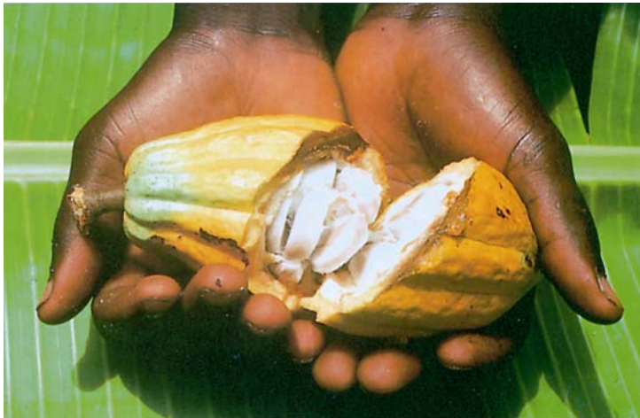
Infozentrum Schokolade, Leverkusen

Wenn sie reif sind, werden sie mit einem scharfen Messer vom Baum abgeschlagen. An den Sammelpunkten öffnen die Erntearbeiter/innen die Früchte mit einem geschickten Schlag ihrer Buschmesser. Aus dem Inneren der Früchte kommen 20 bis 60 Samen, die "Kakaobohnen" genannt werden, zum Vorschein. Diese Bohnen sind eingebettet in ein weißes Fruchtfleisch, die "Pulpa", die sehr süß und gut schmeckt. In den Ländern, in denen der Kakaobaum wächst, lutschen die Kinder die Bohnen mit der Pulpa wie eine Süßigkeit.