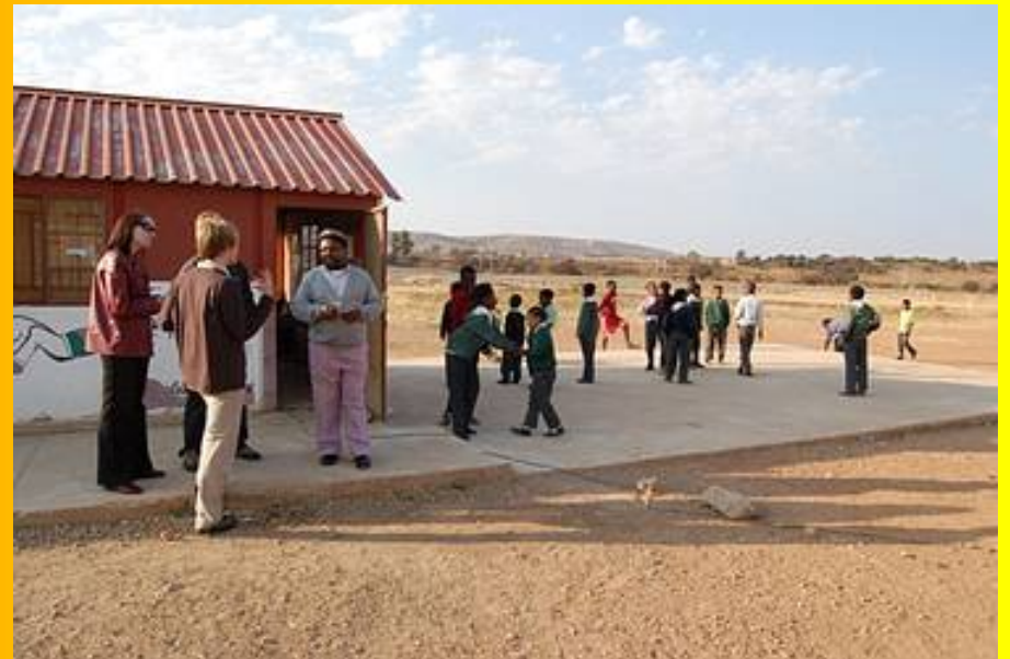
Die Studenten zu Besuch in einer Heartbeat Tagesstätte